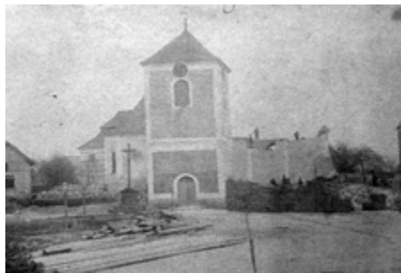
Fotografie Antonína Filipi z roku 1912 zachycuje přestavbu kostela a starou věž s hodinami.

V roce 1894 byly instalovány na 11ti metrové věži zvonice u kostela již pravé věžní hodiny. Byly zakoupeny u pana