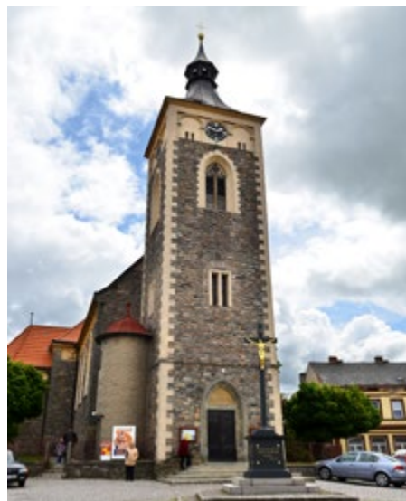
Fotografie Pavla Hodana z roku 2013 zachycuje novou věž kostela s hodinami.