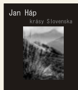
Jan Háp krásy Slovenska