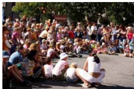
celá fotogalerie na www.prosec.cz