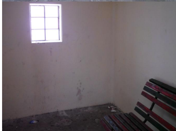
OBJEKT Č. 8 – PROSEČ, PASEKY, ROZHLEDNA