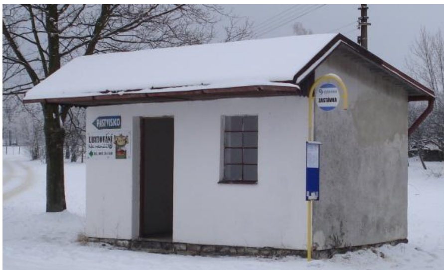
Současný stav zastávky