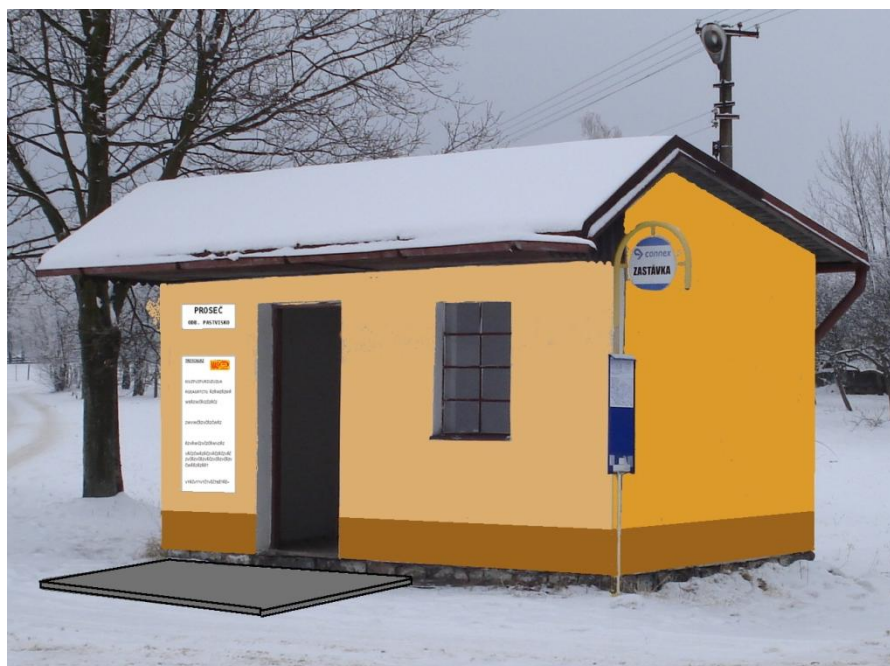
Plánovaný stav zastávky