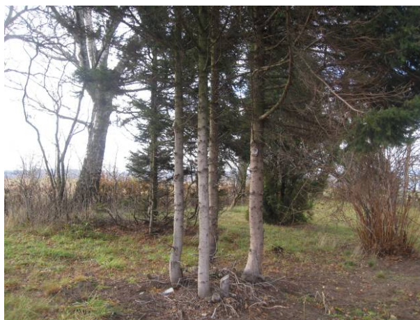
část 5 - Památník gen. Svatoně a kpt. Sošky