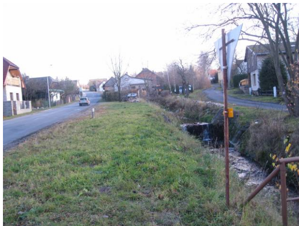
část 3 – Podměstí