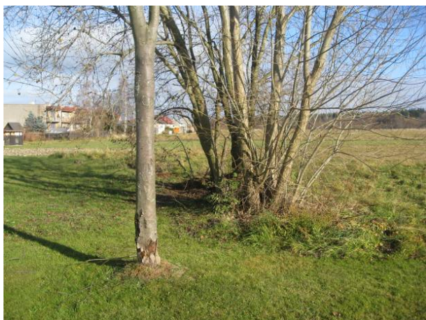
část 4 – Hřiště