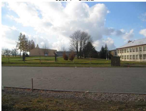
část 1 - Škola