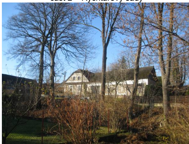
část 2 – Rychtářovy sady