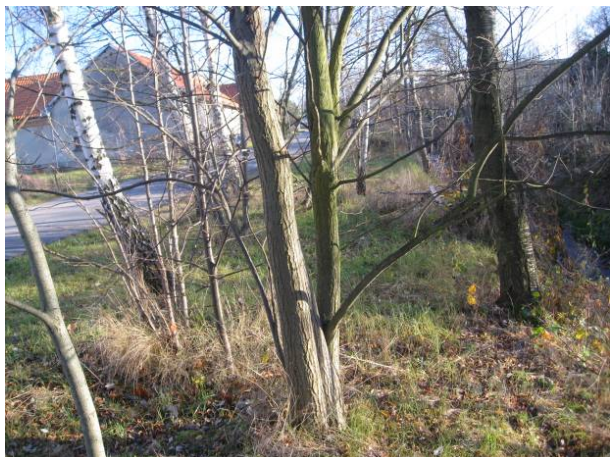
část 3 – Podměstí