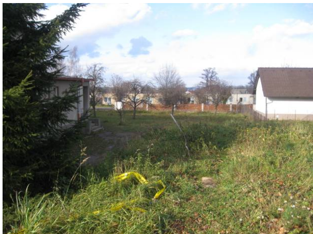
část 1 - Škola