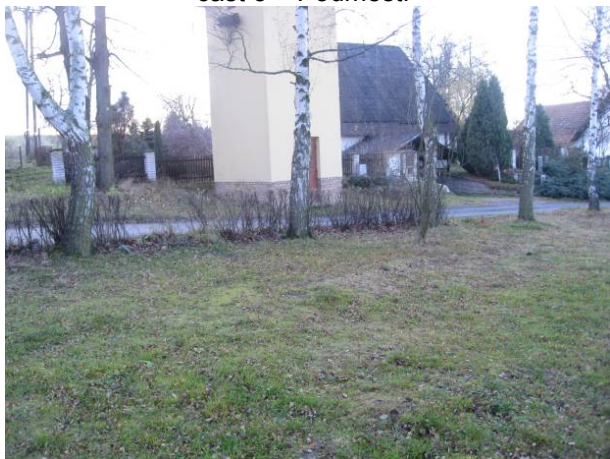
část 3 – Podměstí