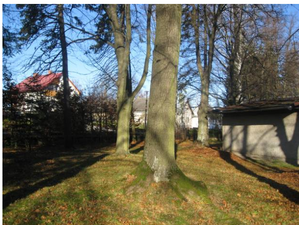
část 2 – Rychtářovy sady