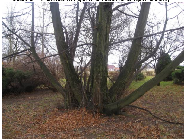
část 5 - Památník gen. Svatoně a kpt. Sošky