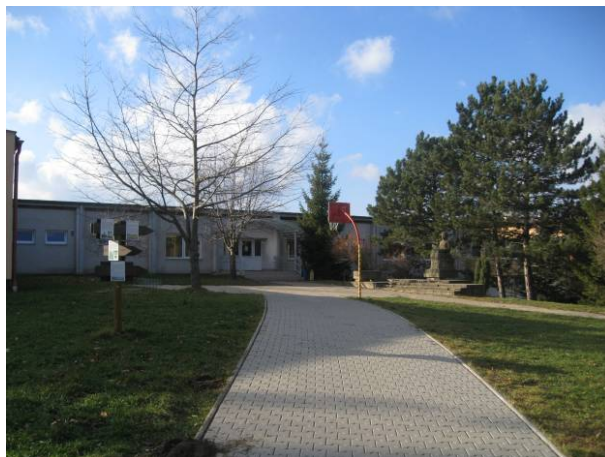
část 1 - Škola