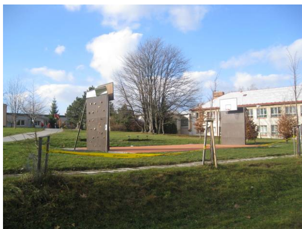
část 1 - Škola