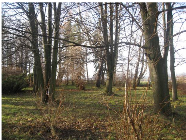
část 5 - Památník gen. Svatoně a kpt. Sošky