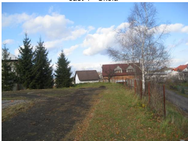
část 1 - Škola