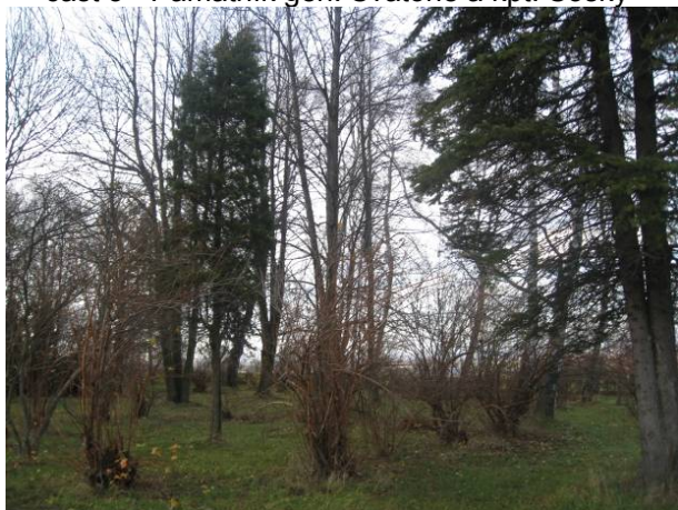
část 5 - Památník gen. Svatoně a kpt. Sošky