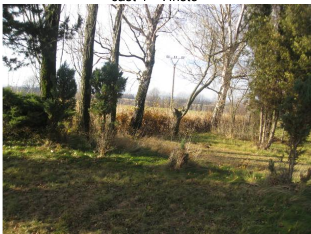
část 5 - Památník gen. Svatoně a kpt. Sošky