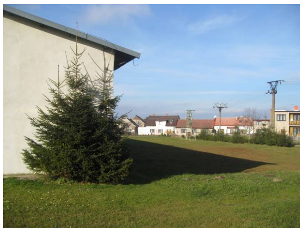
část 4 – Hřiště