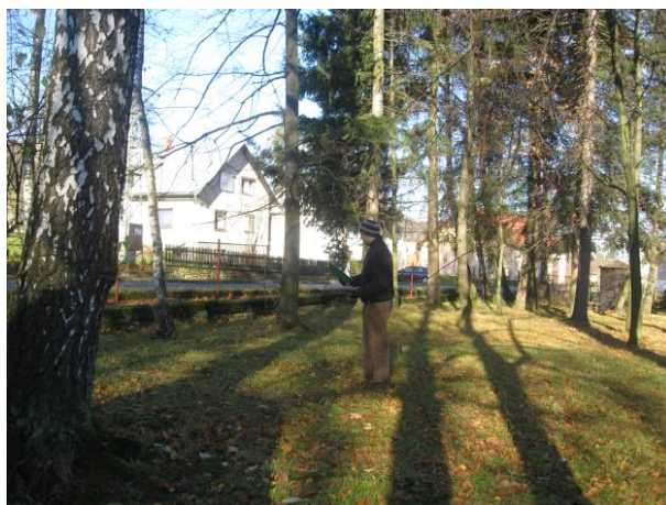
část 2 – Rychtářovy sady