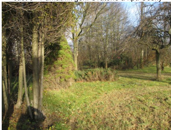
část 5 - Památník gen. Svatoně a kpt. Sošky