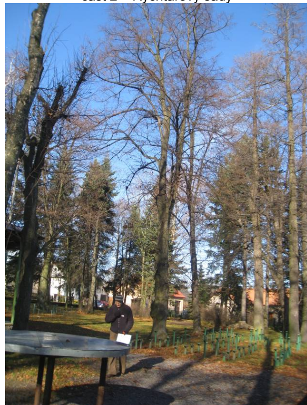
část 2 – Rychtářovy sady