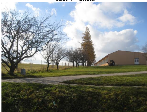
část 1 - Škola