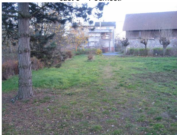
část 3 – Podměstí