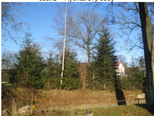
část 2 – Rychtářovy sady