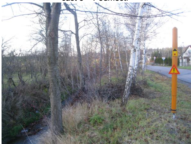
část 3 – Podměstí