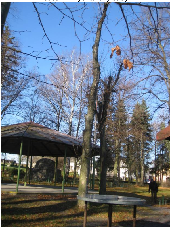
část 2 – Rychtářovy sady