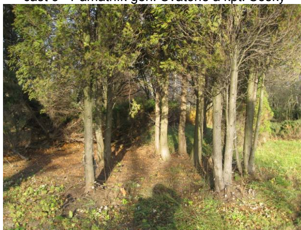
část 5 - Památník gen. Svatoně a kpt. Sošky