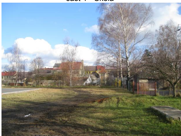
část 1 - Škola