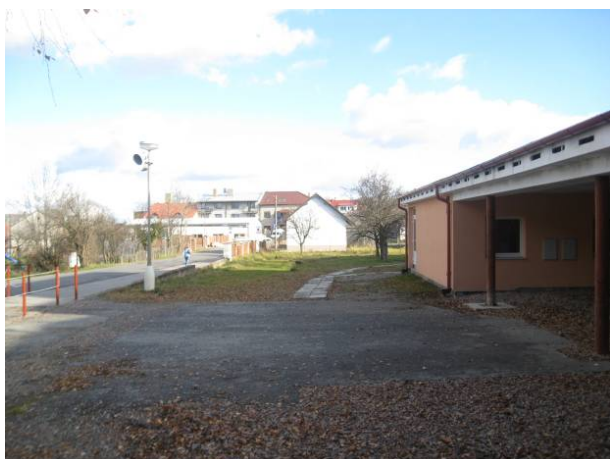
část 1 - Škola