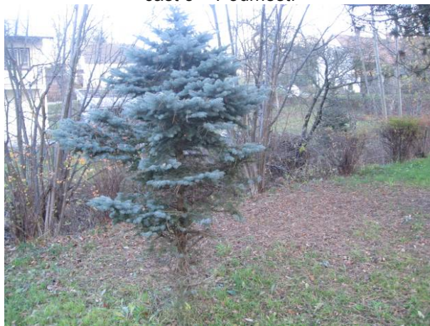
část 3 – Podměstí