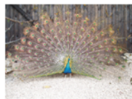
Co nám chutná?

V rámci akce se budou prodávat ručně zhotovené kožené suvenýry. Výtěžek je určen na provoz stanice.